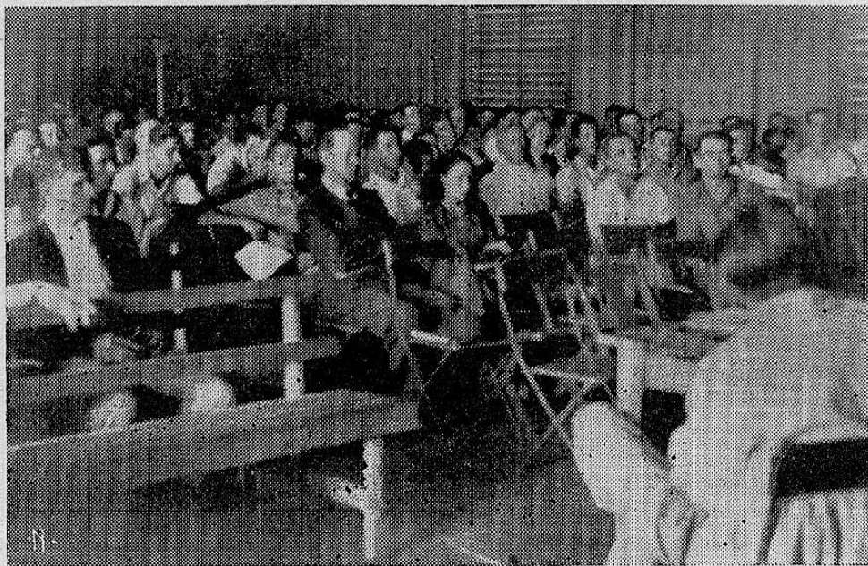
Un aspecto de la Asamblea General de la Cooperativa Tabacalera.

Las circunstancias actuales de Costa Rica permiten y exigen una mayor producción agrícola, sobre todo, un planeamiento más eficiente y un mayor tecnicismo en la agricultura nacional; pensemos en las cooperativas como uno de los medios más eficientes de lograr esos fines.